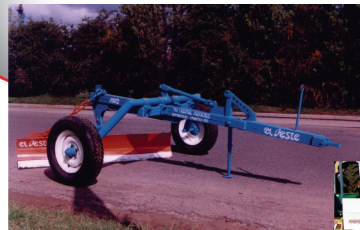
ACCESORIO HOJA NIVELADORA